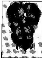
Γράφει ο Δικηγόρος Κων. Παν. Βέμμος

Εδώ και 4-5 χρόνια γινόμαστε μάρτυρες της επιδίωξης πολλών ιδιωτικών εταιρειών, να εγκαταστήσουν μονάδες παραγωγής ηλεκτρικής ενέργειας από ανεμογεννήτριες (αιολικά πάρκα) στην περιοχή της Επαρχίας Κυνουρίας. Ετσι, γνωρίζουμε από την ιστοσελίδα της Ρυθμιστικής αρχής ενέργειας (Ρ.Α.Ε.) W.W.W. RAE.gr ότι εγκρίθηκαν ή εκκρεμούν προς αδειοδότηση, περίπου είκοσι (20) άδειες σε διάφορες βουνοκορφές του Δήμου Β. Κυνουρίας και του Δήμου Λεωνιδίου.